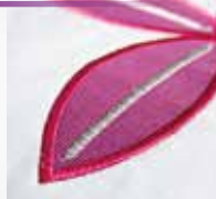
Tapering für mehr Variation beim Nähen.

Tapering – Mit allen 9-mm dekorativen Zierstichen. Nähen Sie Ihren Stich am Anfang und/oder Ende spitz zulaufend. Der Winkel der auslaufenden Stiche kann darüber hinaus noch verändert werden, für einen individuellen Look.