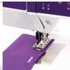
Knopflöcher schnell und präzise genäht mit der PFAFF® Knopfloch-Sensormatik.

Garantiert professionelle Knopflöcher auf jedem Stoff. Geben Sie einfach die Länge des Knopfloches ein. Die expression™ Nähmaschinen speichern diese und nähen das Knopfloch immer wieder in der gleichen Länge und Qualität.